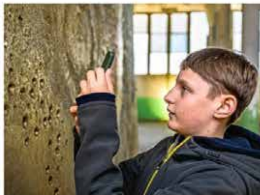
Opperste concentratie bij het nemen van een foto.

„Ga eens een beetje door de hurken, dan lopen de lijnen mooier in elkaar over.”