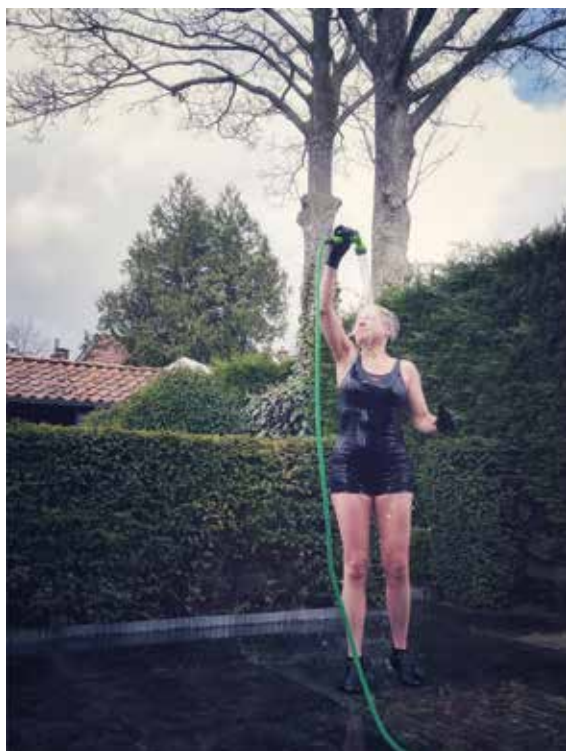
Een Vrij(e) Sterke Vrouw Foto 42 x 75 cm

groepsexpo Mijn vrijheid, Jouw vrijheid Locatie Café Fabriek, Jan Sijbrandsteeg 42, Zaandam, thema Vrouwen en Vrijheid