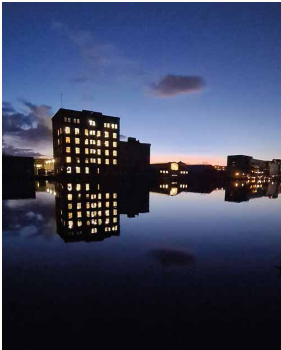
De Zaan bij Zaandam