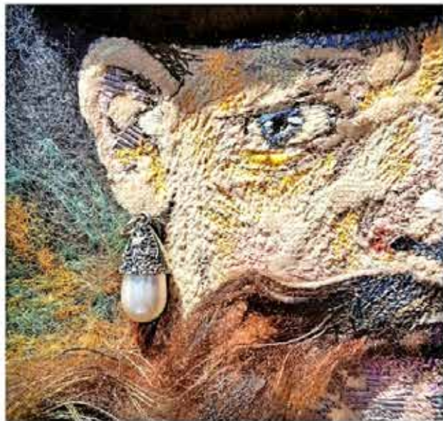
Een detail uit 'Ten Poolse Edelman'.

Soortgelijke initiatieven zijn ook al in andere delen van het land gestart, zoals de eendaagse expositie