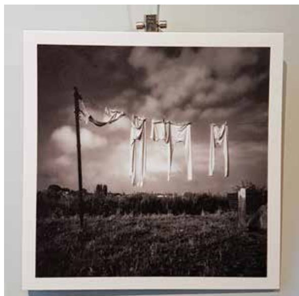
Foto 2x verkocht: aan Yvonne de Groot en Cilly Koeman/Peter Langenberg